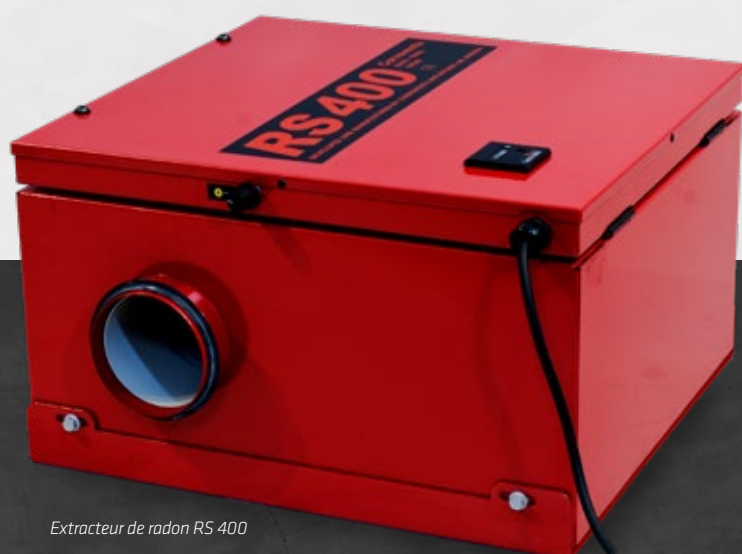
Extracteur de radon RS 400