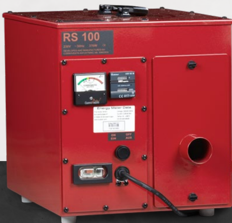
Extracteur de radon RS 100