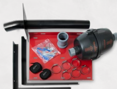
Kit de montage complet pour pose et montage de l'extracteur de radon RS100 sur un mur ou au plafond.